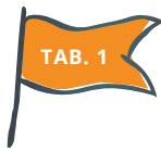
Steuerungstheoretische Schärfung der Funktionslogiken der Evaluationsforschung